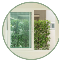
Infissi ad alte prestazioni termiche e acustiche