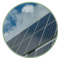
Impianto fotovoltaico dedicato (2kW per unità)