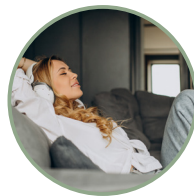
Isolamento termico ad alte prestazioni