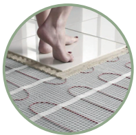
Riscaldamento a pavimento