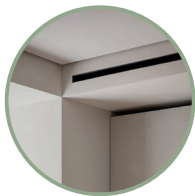
Ventilazione meccanica controllata puntuale