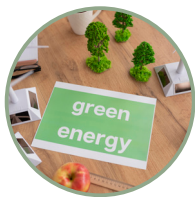
Classe energetica A4