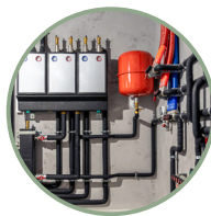
Sistema ibrido con pompa di calore e caldaia