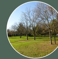
PARCO DELLA RESISTENZA 4 minuti a piedi