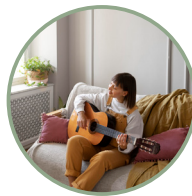
Isolamento acustico ad alte prestazioni