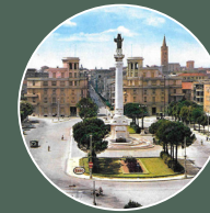
PIAZZALE DELLA VITTORIA 400 metri