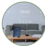
Gestione domotica smart+